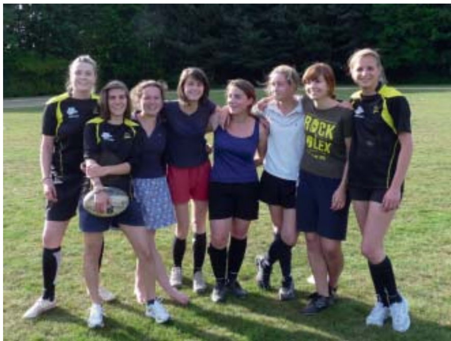
Non, ce n'est pas réservé aux gars.