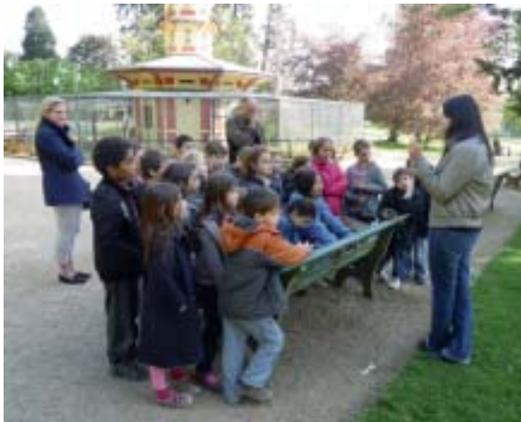
Le Thabor : la nature dans la ville.

Mardi 12 avril. Les CE1 en projet sur la biodiversité animale, se sont rendus à la faculté des sciences de Rennes, sur le campus de Beaulieu.