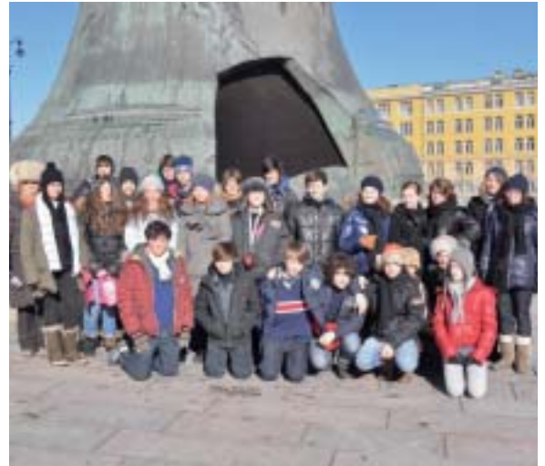
Le groupe à Moscou.

Nous étions vingt-cinq élèves, toutes classes et tous niveaux confondus, à partir pour Moscou ce samedi 26 février. L'échange se faisait avec l'école n°1284, située en plein centre de la ville. C'est sous la neige que nous avons découvert la capitale russe. La semaine de notre séjour était la semaine de Maslénitsa, c'est à dire la semaine grasse; et la tradition voulait que nous dégustions thé et blinis (crêpes russes) dès que l'occasion se présentait. C'est donc entre une tasse de thé et quelques blinis que nous avons visité