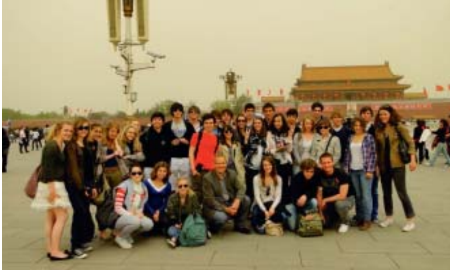
Le groupe sur Tien An men.

Durant les vacances de Pâques, Pékin n'a cessé de nous surprendre, nous 32 élèves en ECE/ECS, par sa richesse culturelle, historique et gastronomique. Ces 10 jours nous ont permis de visiter les principaux sites de Pékin tels que la Cité Interdite, la Grande Muraille, le Temple du Ciel ou le Palais d'été, sans quoi nous n'aurions pu admirer l'architecture chinoise qui rayonne par l'éclat de ses