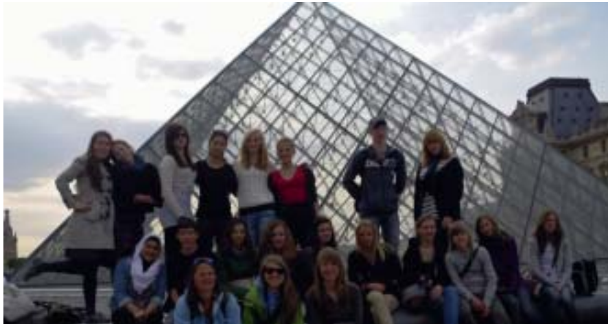
A Jena ...

Quelques témoignages d'élèves sur notre séjour du 29 septembre au 8 octobre 2010.