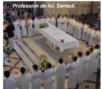
Profession de foi. Samedi.