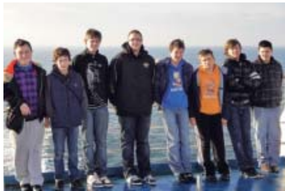
Le mer était bonne ... ouf !

Nous sommes partis à Londres du 15 au 18 mars. Nous avons visité Big Ben, le quartier de Westminster, Buckingham palace, la tour de Londres.