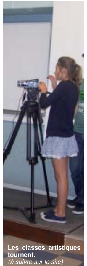
Les classes artistiques tournent. (à suivre sur le site)