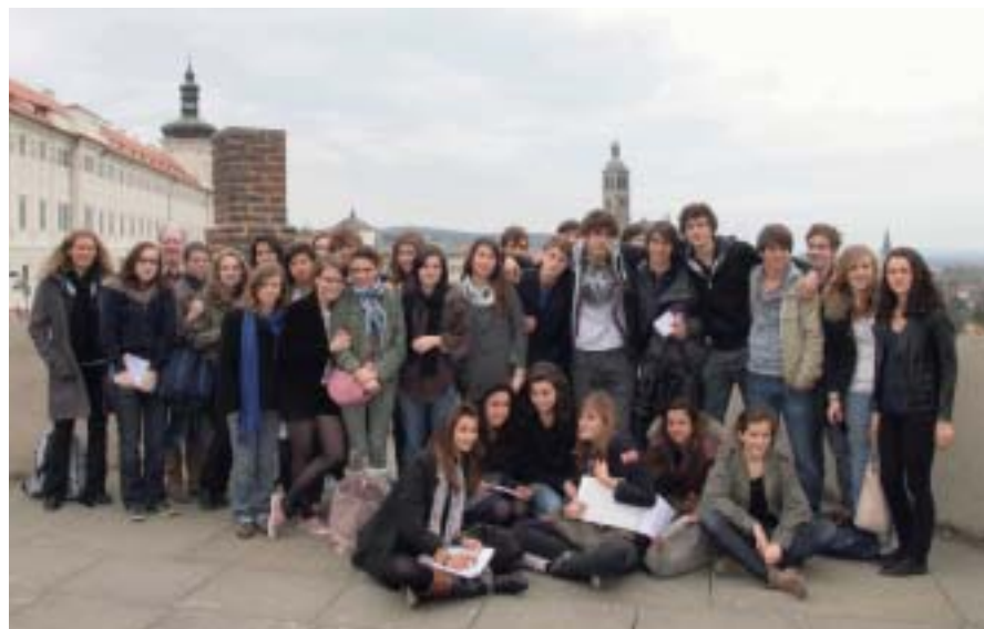
Le groupe à Prague.

Samedi 8 avril, de retour à Rennes, un mot résonne dans tous les esprits : " inoubliable". En effet après 10 jours en République tchèque, les élèves de secondes 4 et 5 en ont plein la vue et plein l'appareil photo. Prague est une ville splendide, historiquement passionnante. Quant aux Tchèques, ils ont été extrêmement chaleureux. C'est donc , le sourire aux lèvres