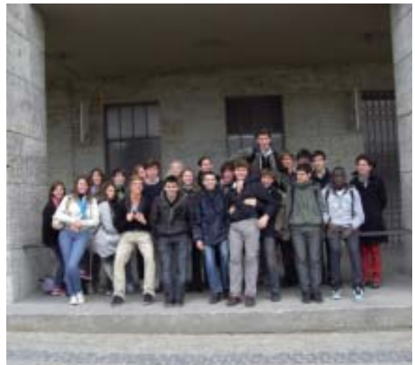
Un groupe enthousiaste à l'image du texte de cet article.

1er avril 2011. En gare de Rennes à l'aube, nous nous retrouvons pour donner vie à ce nouveau projet : un échange d'une semaine avec des élèves d'un des lycées les plus prestigieux de Berlin.