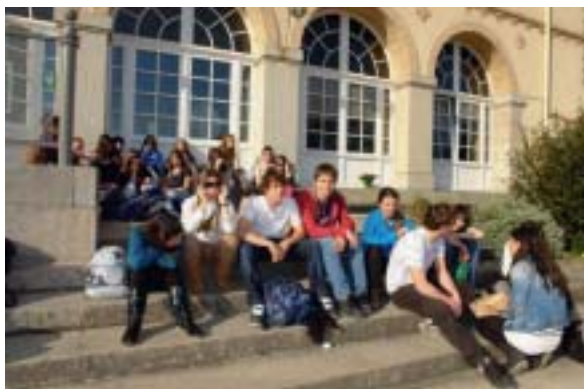
Les marches de Saint-Vincent : lieu de rencontre privilégié.