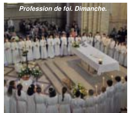
Profession de foi. Dimanche.