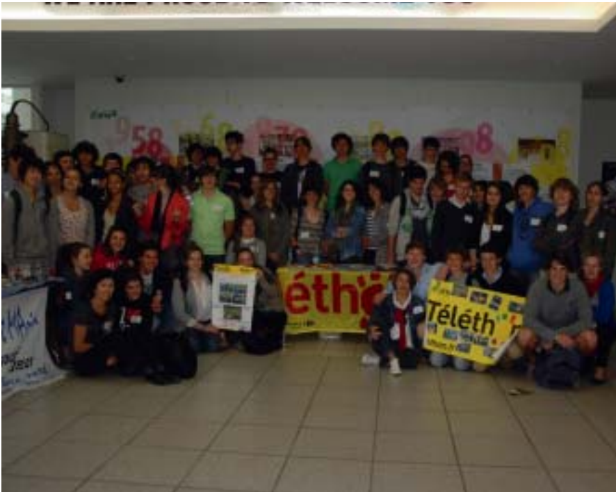
Une visite exceptionnelle bien méritée.

Le vendredi 27 Mai 2011, nous élèves de 1ère S 6 & 7 avons attentivement visité le Généthon à Evry.