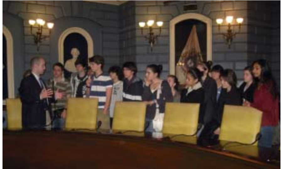
Talking with Senator Downing in the Massachusetts Senate;

A group of sixteen students, accompanied by lycée OIB teachers Mrs Green and Jester, went to Boston, Massachusetts, for the first ever History-themed OIB trip. The trip included a visit to the Massachusetts State House, and a conference with Senator Benjamin Downing. Senator Downing took time out of his busy schedule to explain the life of a state senator to the students, take their questions,