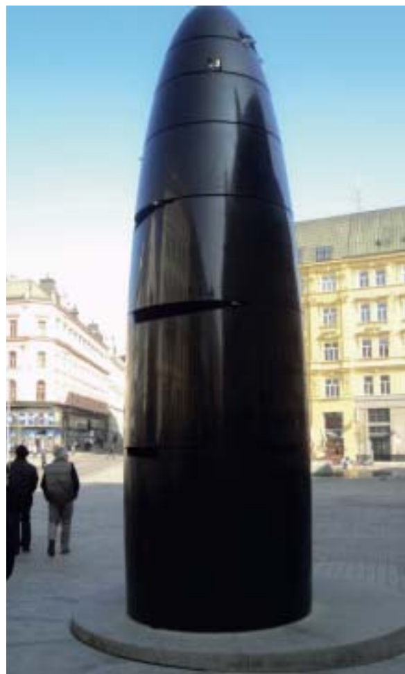
Horloge monumentale sur la place de la Liberté à BRNO.