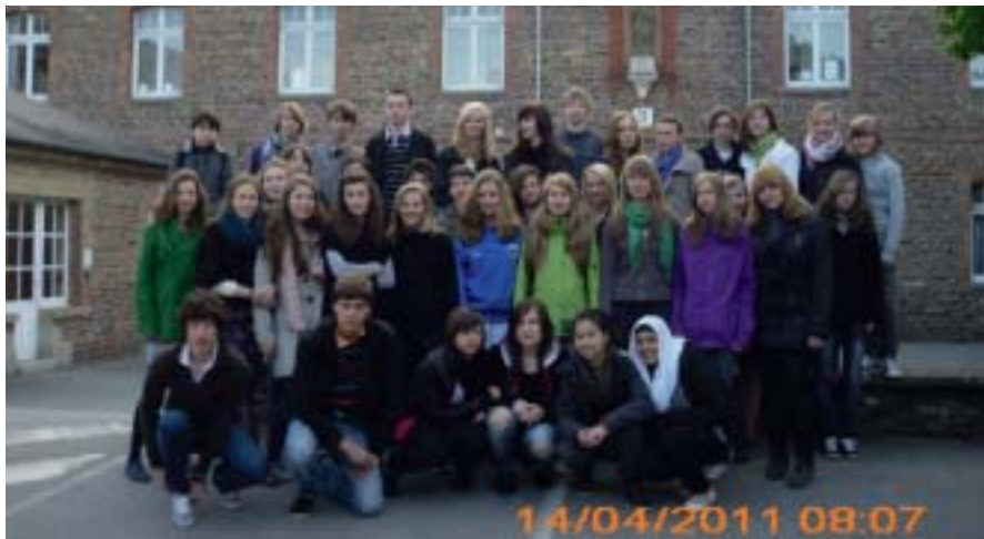
... ou à Rennes ... on est bien ensemble.