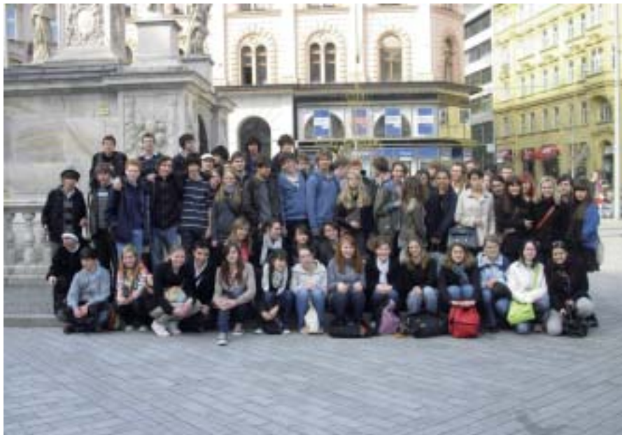
Le groupe, place de la Liberté à BRNO.

That's it... It's the end of our wonderful journey. For a week, students of the European section visited the Czech Republic. We were divided into two groups between the cities of Prague and Brno.