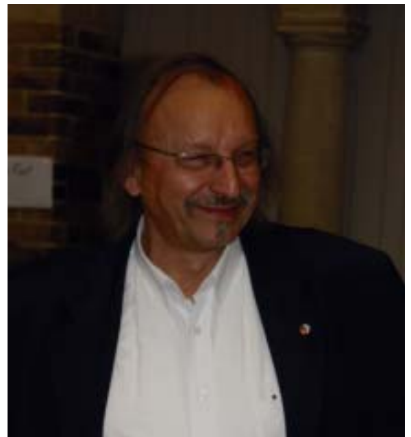
Un bon souvenir pour lui aussi ...