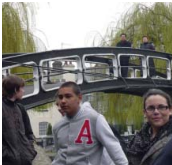
Tout est à découvrir.