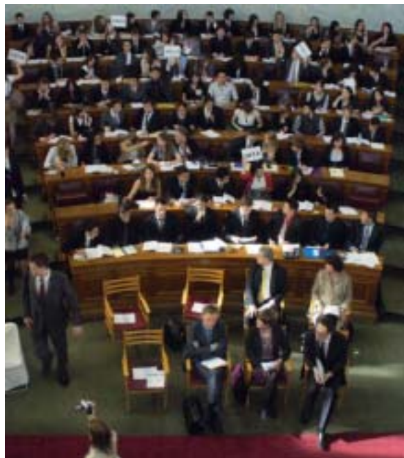
Saint-Vincent à Athènes en avril 2011. (Le Parlement Européen des Jeunes.