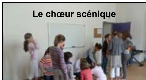
Le chœur scénique