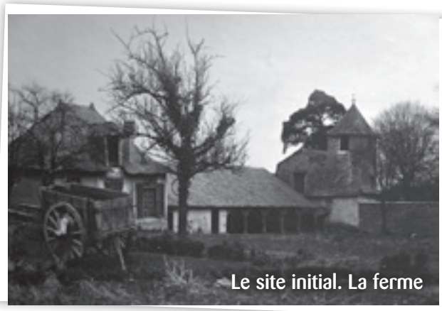
Le site initial. La ferme

le vote -prévisible- de la loi de Séparation des Eglises et de l'Etat de décembre 1905, mais juste après la loi sur les associations du 1 er juillet 1901. Le bail de neuf années signé par la société de l'Enseignement prenait fin légalement le 1 er août 1912.